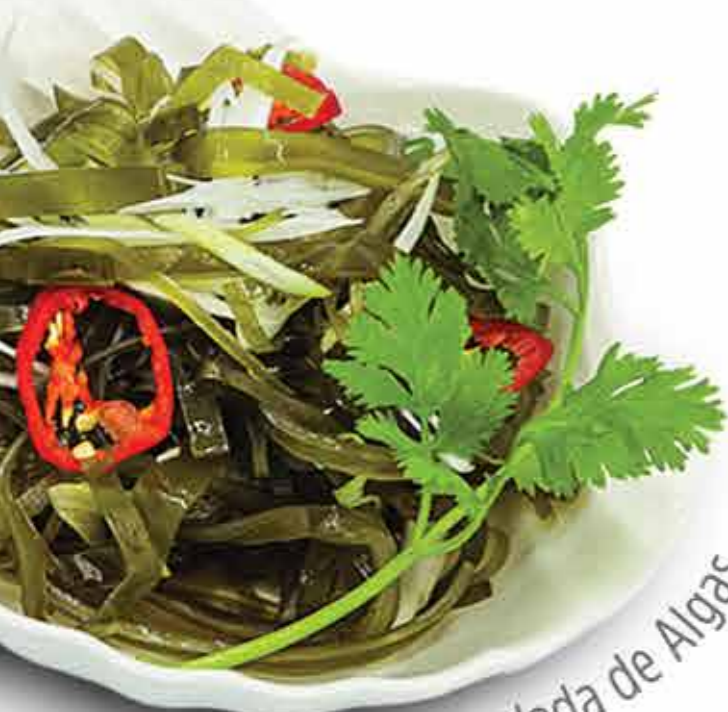
Ensalada de Algas