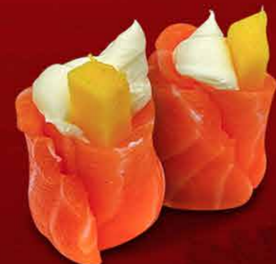
Geisha de Fátima x6 48.000 Gs.