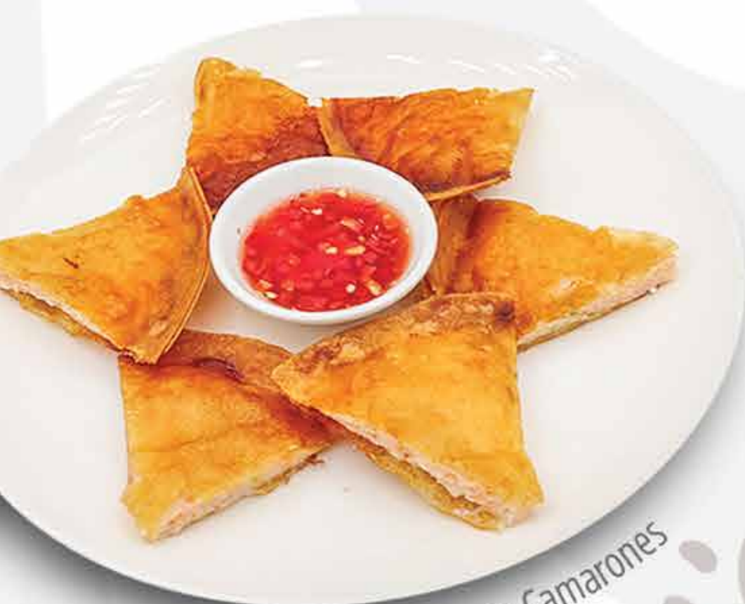
Luna de Camarones