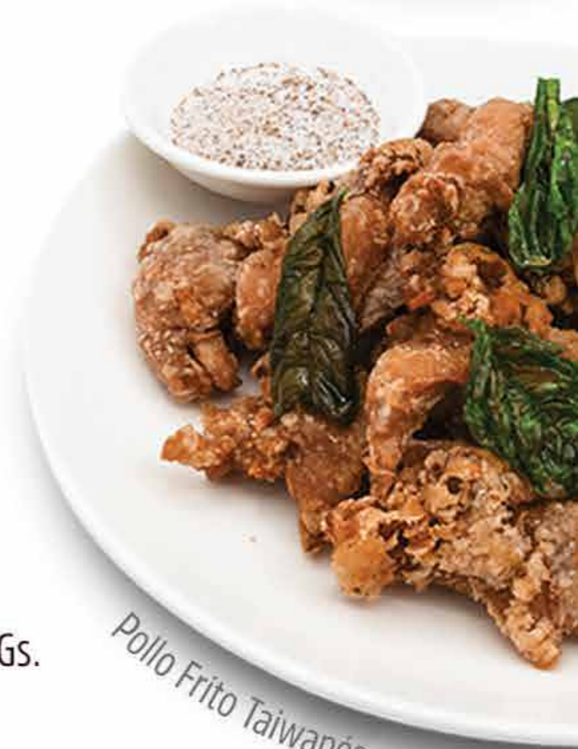
Pollo Frito Taiwanés