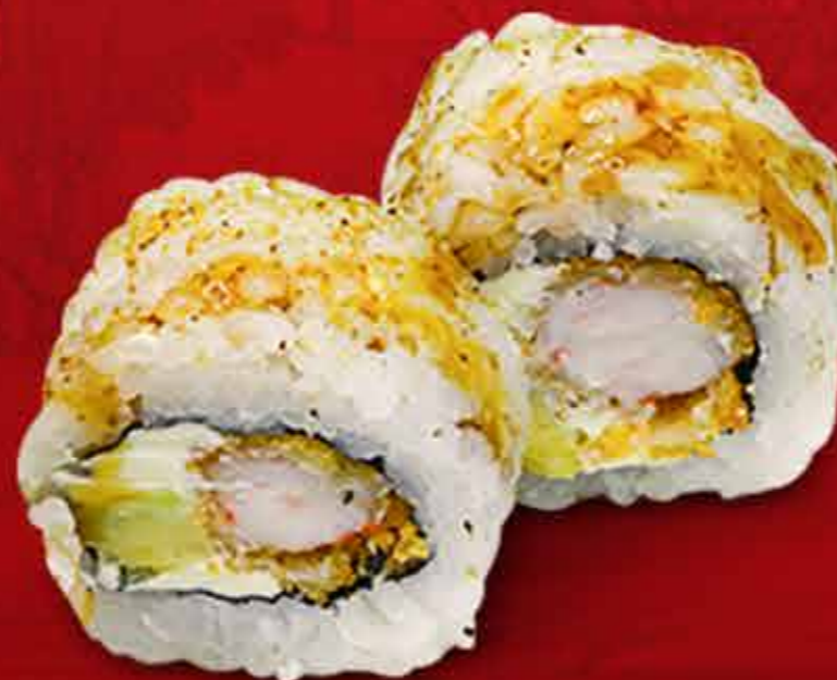
Ebi Fry Roll x8 58.000 Gs.