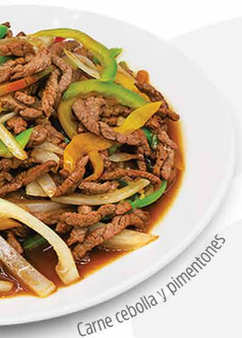
Carne cebolla y pimentones