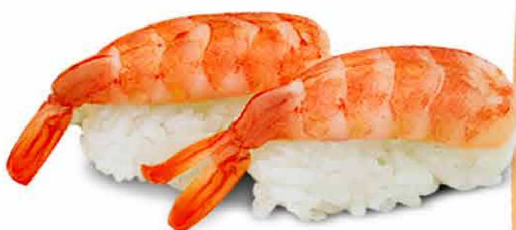
Nigiri de Langostino x4 38.000 Gs.