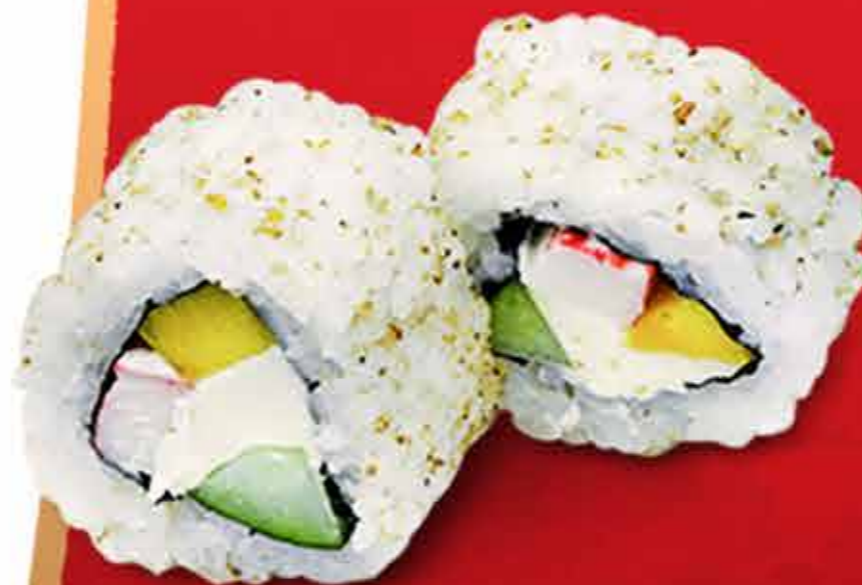
California Roll x8 42.000 Gs.