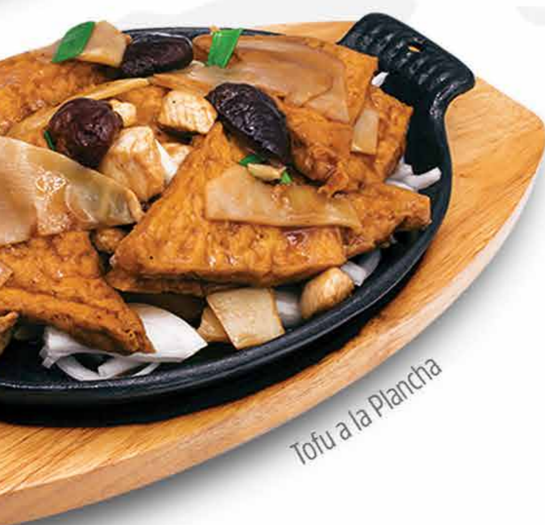
Tofu a la Plancha