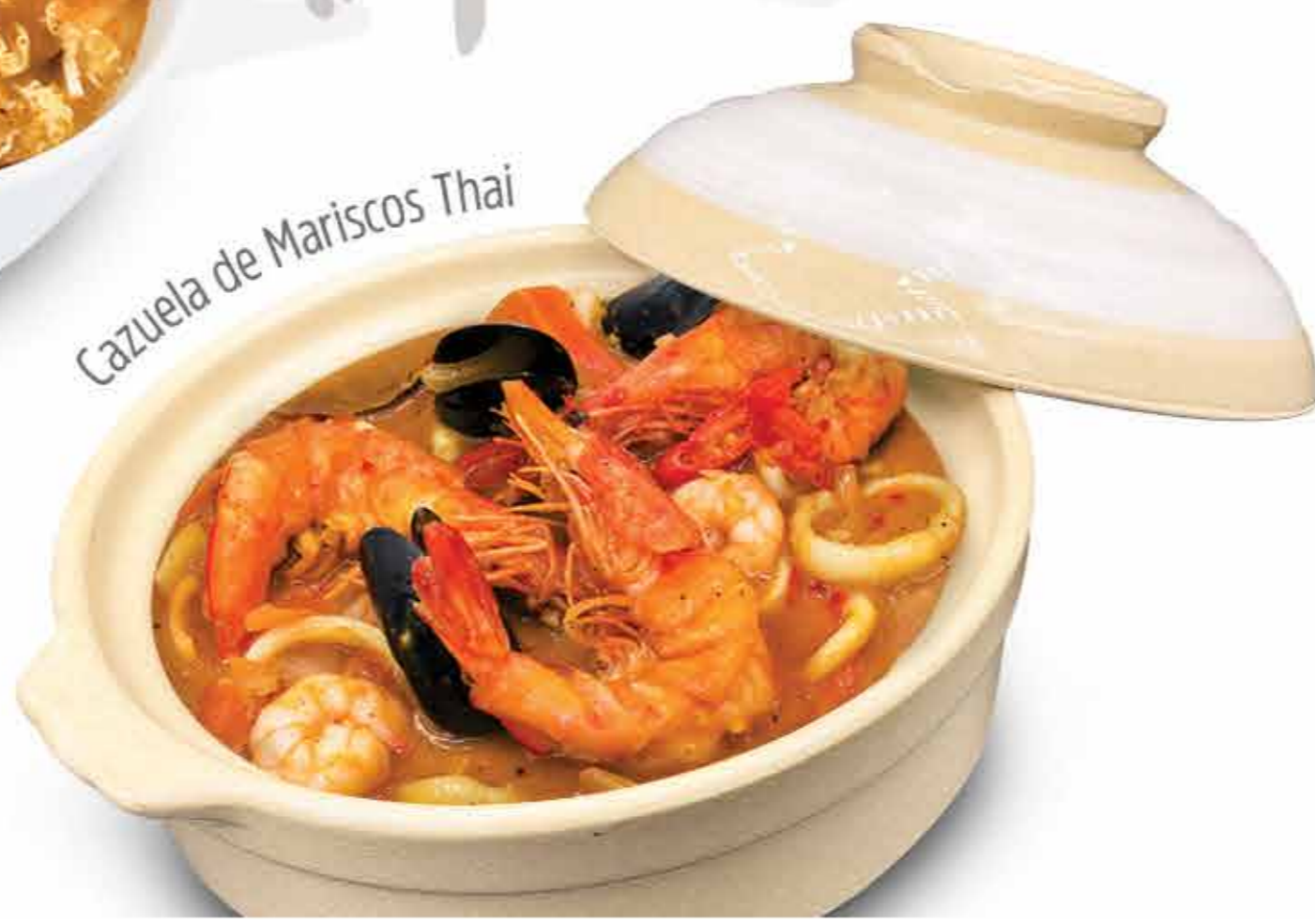
Cazuela de Mariscos Thai