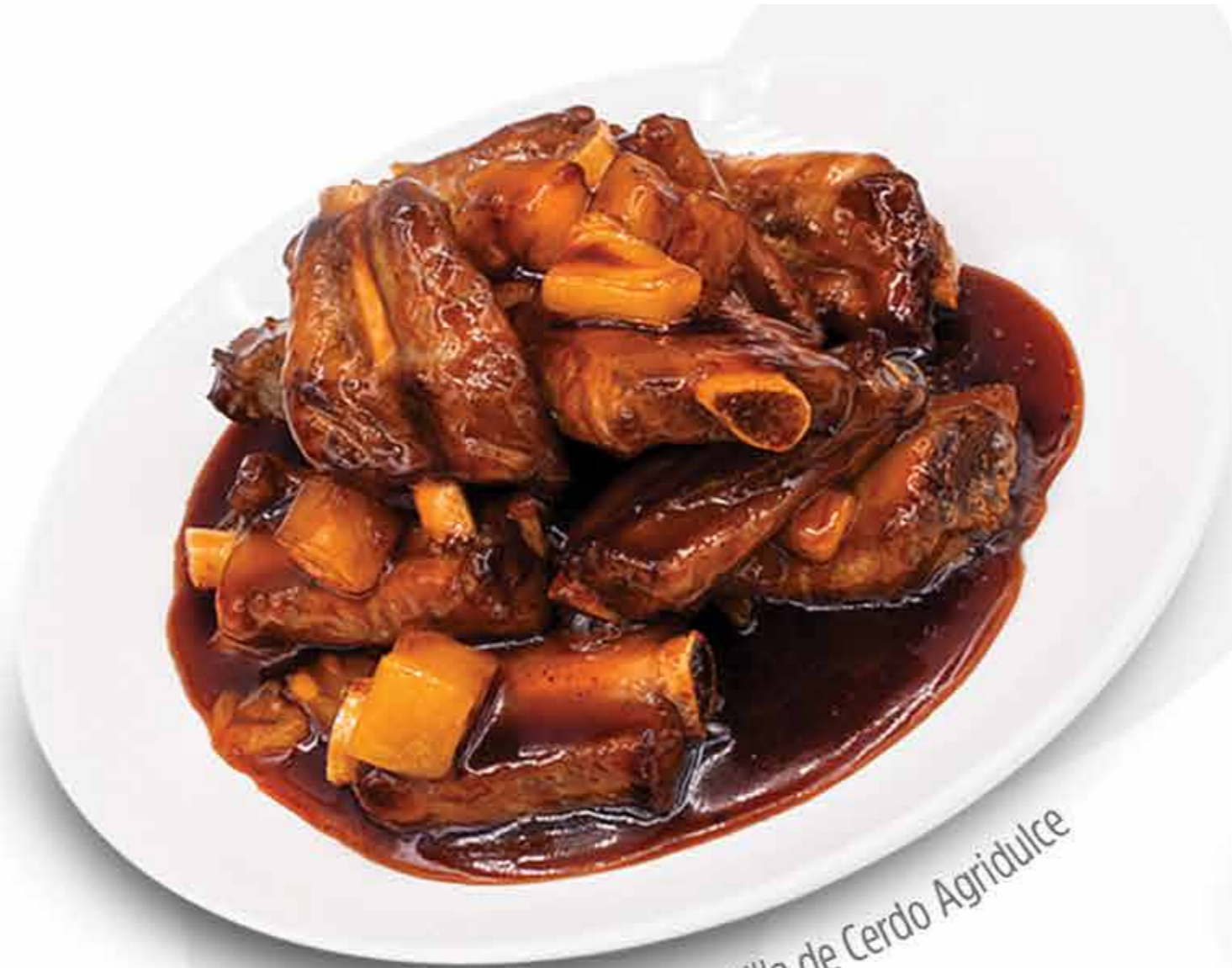
Costilla de Cerdo Agridulce