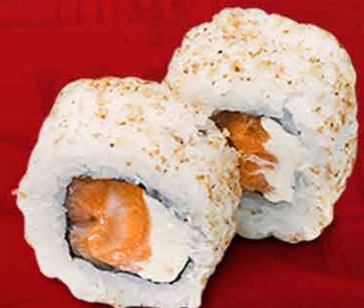
Filadelfia Roll x8 58.000 Gs.