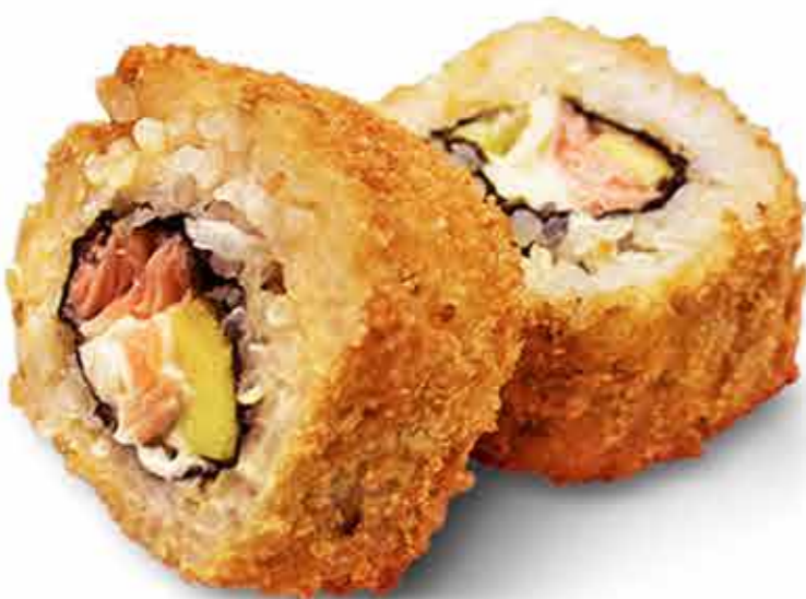
Hot Salmon Roll x8 54.000 Gs.