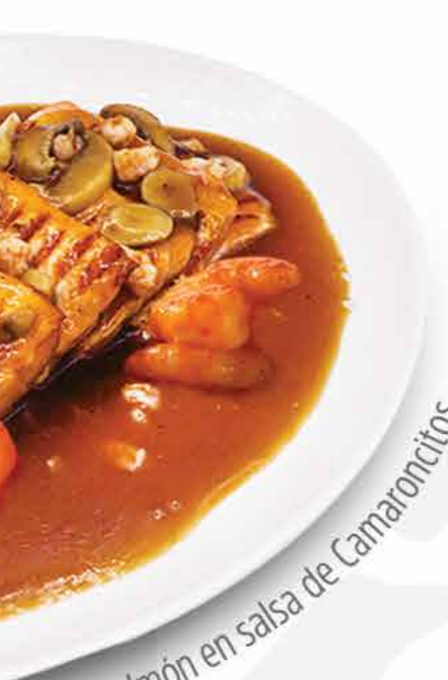
Salmón en salsa de Camaroncitos