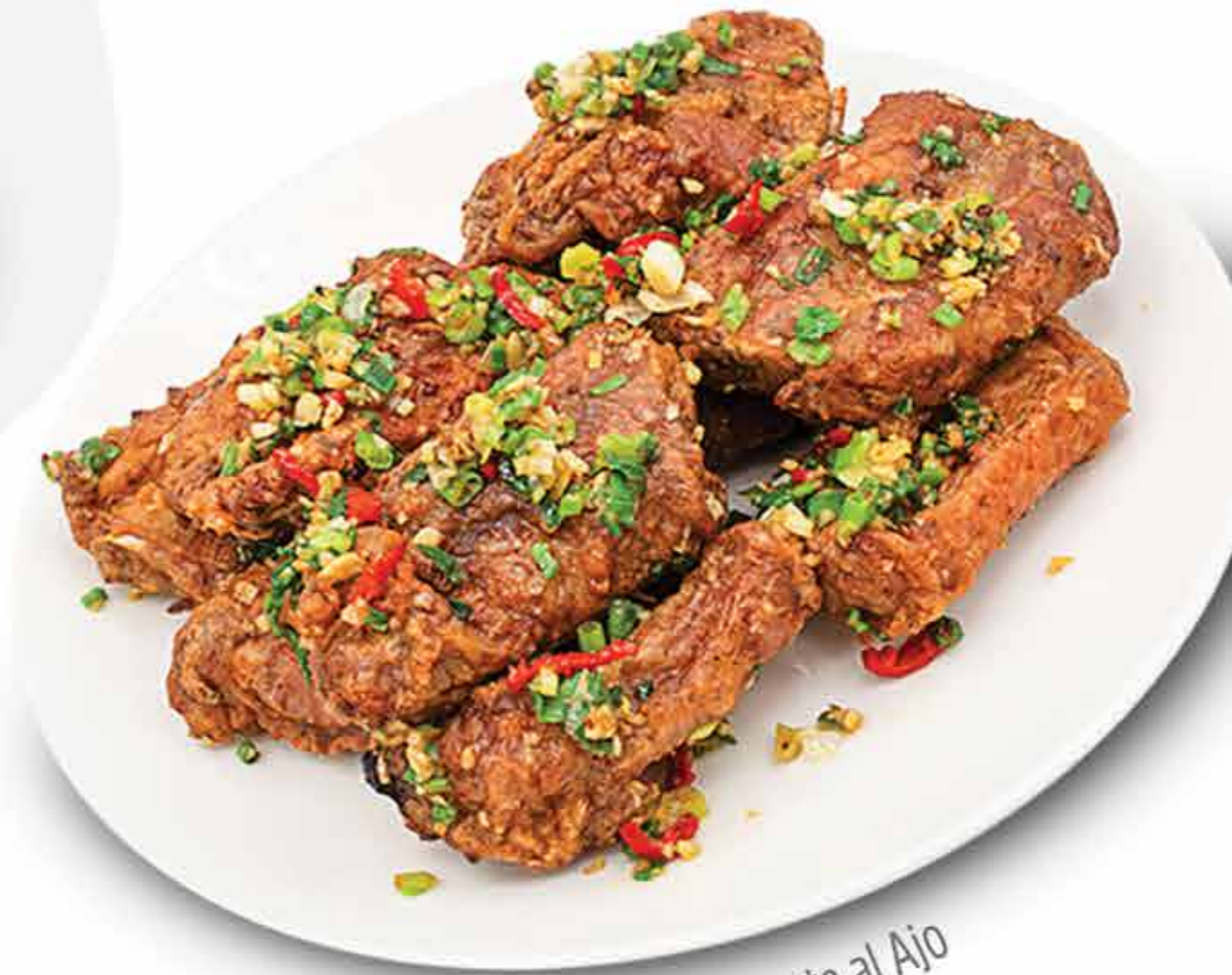
Costilla Picante al Ajo