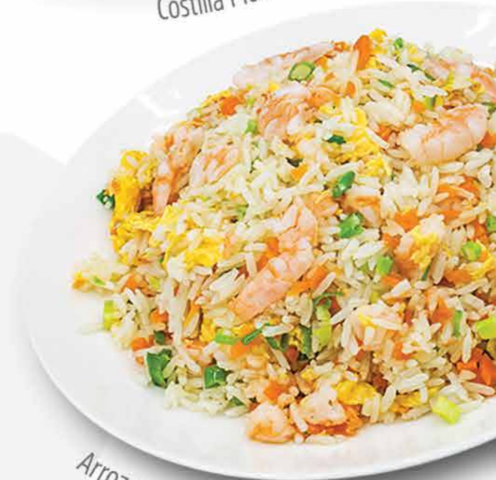
Arroz con Camaroncitos