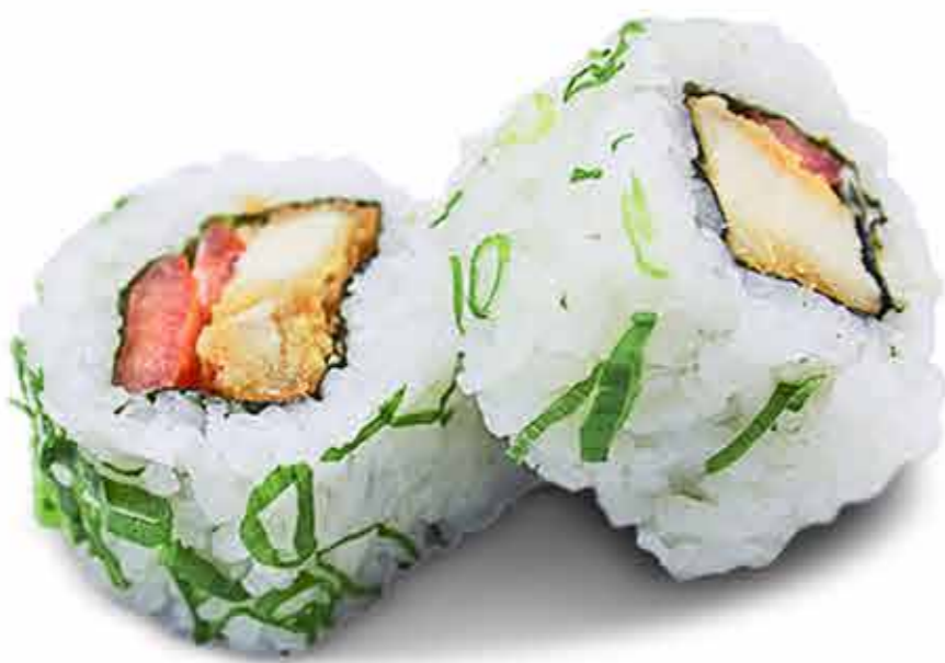
Pollo Crujiente Roll x8 42.000 Gs.