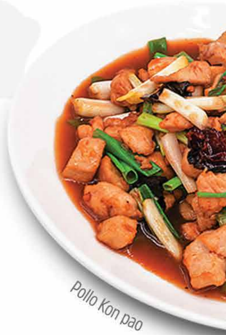
Pollo Kon pao