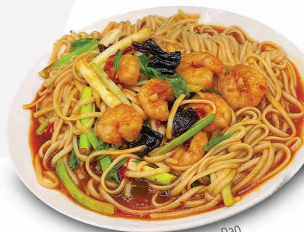
Fideo Kon Pao