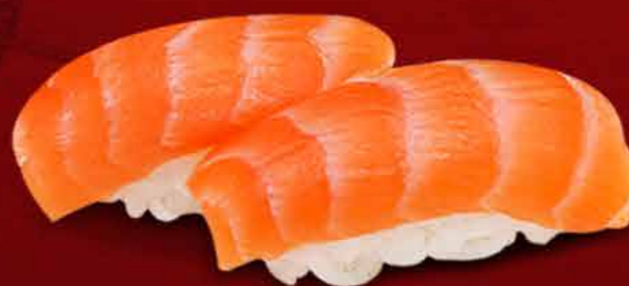
Nigiri de Salmon x4 38.000 Gs.