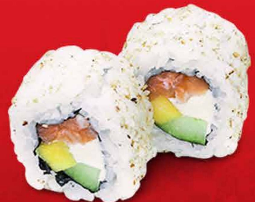
California Salmon Roll x8 54.000 Gs.