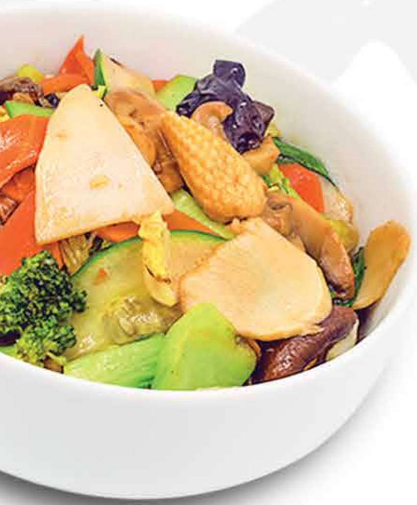
Bambu con Hongos